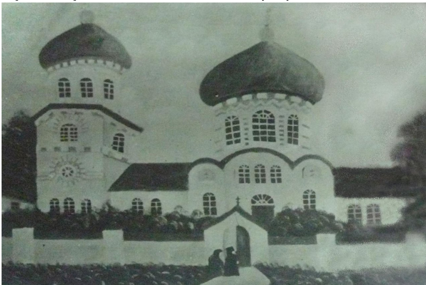
Томаківська церква у святковий день (1920-і роки)

- Христос Воскрес! - зі невгасаючим оптимізмом знову віщував священник.