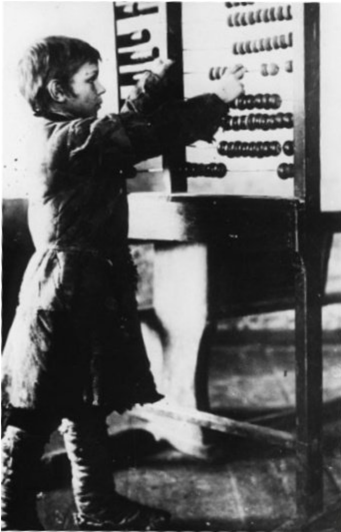
Завантаження арештантів у вагон

– Давай ще раз так само, але тільки після того, як я кольну, – тихо пробурмотів один із організаторів завантаження на вухо Петрові. – Спробуй на секунду зачепитися плечем, а в цей час хлопці посунуть ворота.