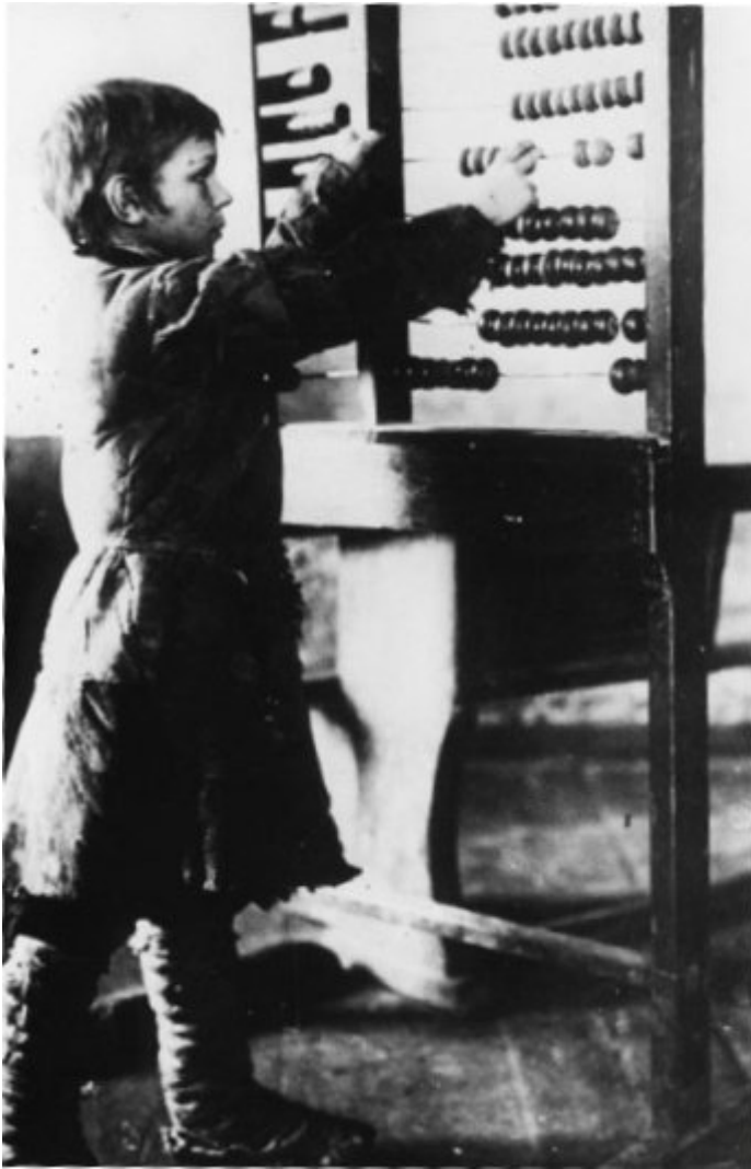
Урок арифметики в школі