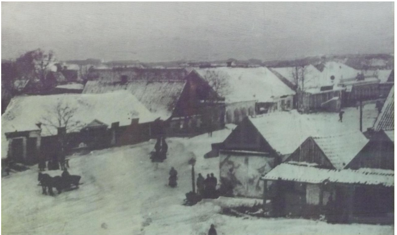
Центр Томаківки (початок 20-го століття)

Тільки одна установа справно працює в Томаківці – лікарня. Вона необхідна будь-якій воюючій владі, будь-якому генералу й отаману: треба лікувати поранених і хворих, годувати й забезпечувати ночівлею здорових.